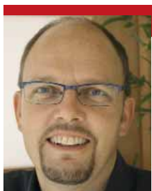
Dr. Ida P. Rolf