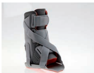
Otto Bock HealthCare GmbH, Duderstadt

Eine den Heilungsphasen gerechte Verletzungsversorgung im oberen und unteren