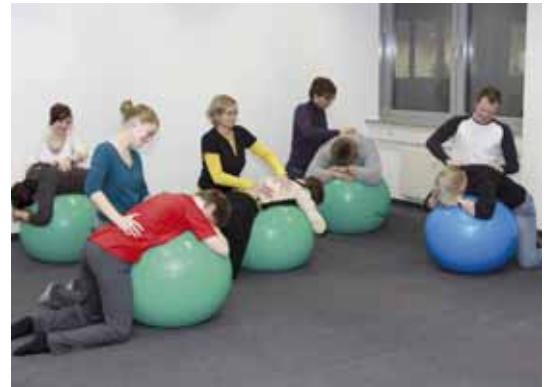
Päventions- und Gesundheitstrainer Die neue Rückenschule für Erwachsene (KddR-Konzept)

Vorschau pt 9_2010 Erscheinungstermin 15. September 2010