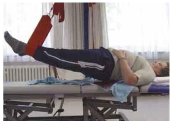
Fallbericht Unspezifische lumbale Rückenschmerzen Behandlung nach Konzepten oder nach Evidenz?